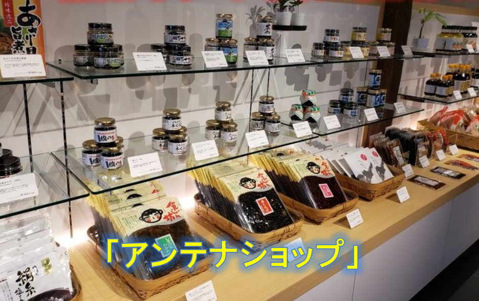
「アンテナショップ」