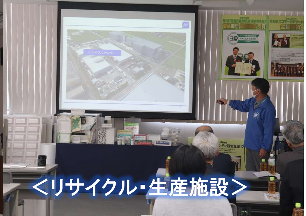
<リサイクル・生産施設>