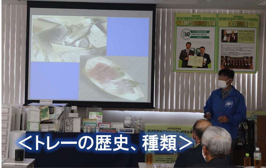
<トレーの歴史、種類>