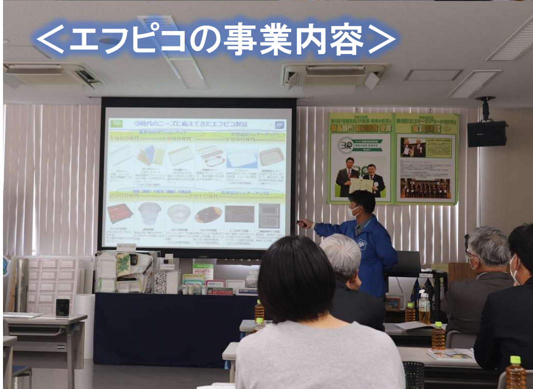
<エフピコの事業内容>