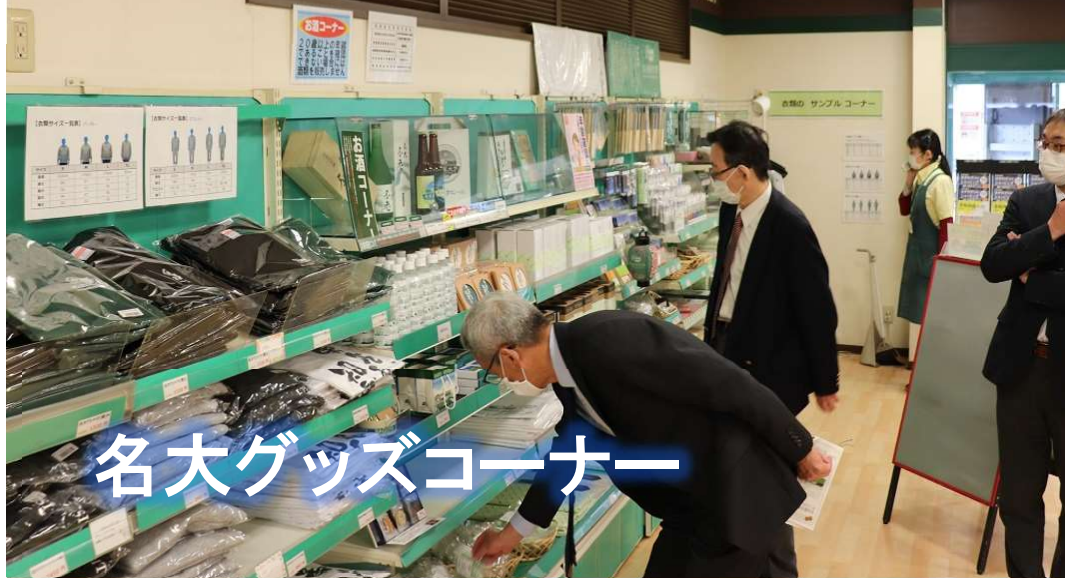
名大グッズコーナー