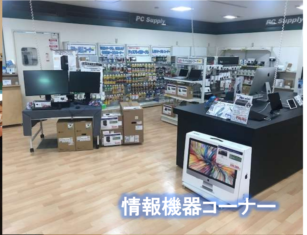
情報機器コーナー