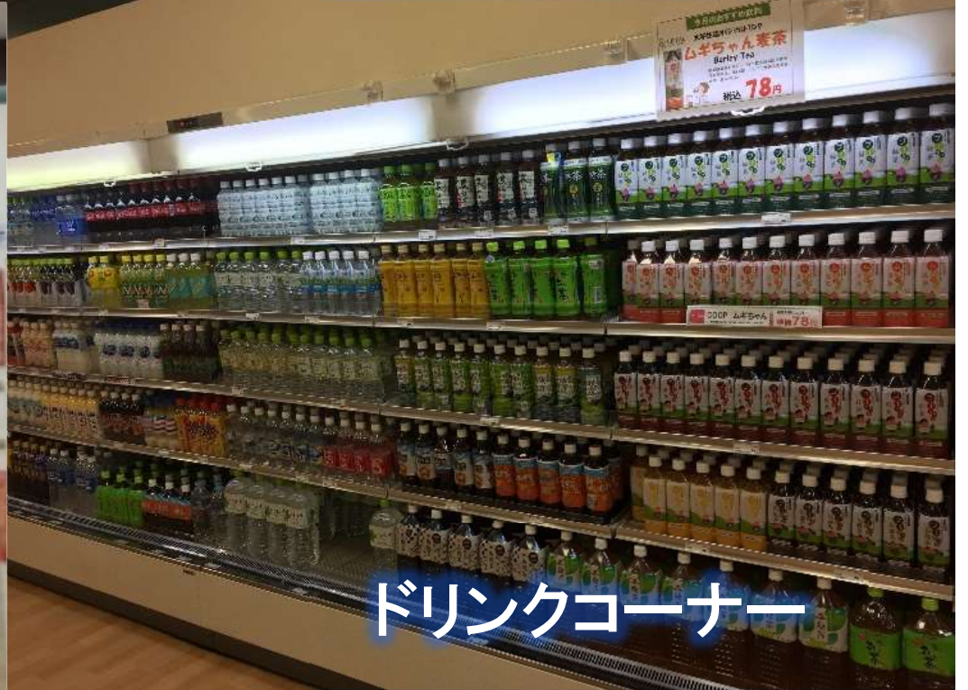
ドリンクコーナー