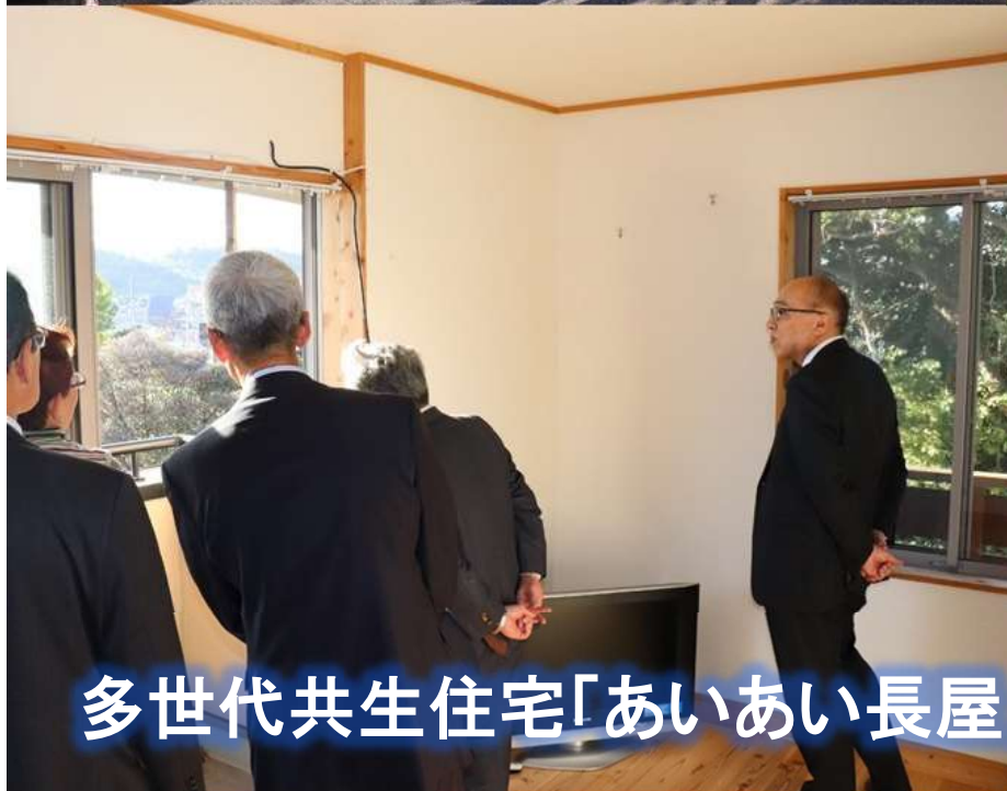
多世代共生住宅「あいあい長屋」