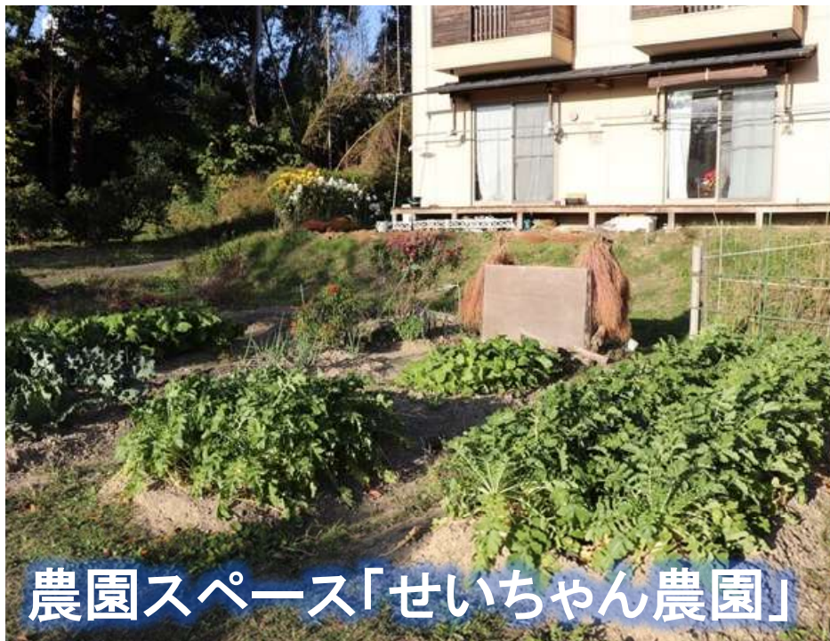
農園スペース「せいちゃん農園」