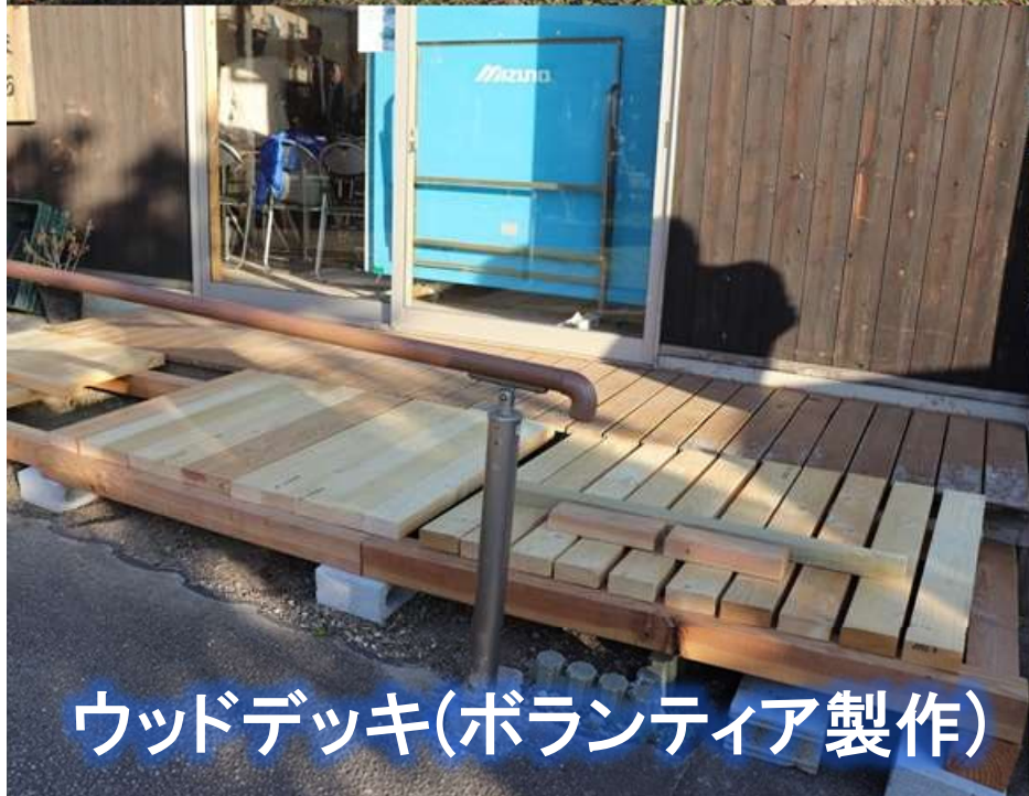
ウッドデッキ(ボランティア製作)