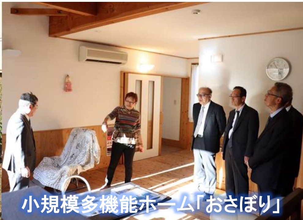
小規模多機能ホーム「おさぼり」