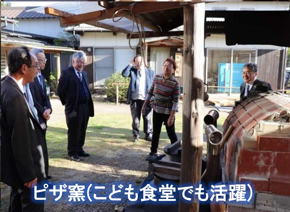
ピザ窯(こども食堂でも活躍)