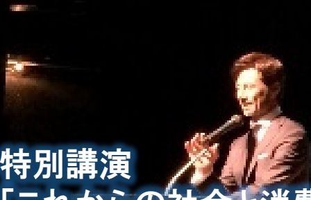
特別講演 「これからの社会と消費」