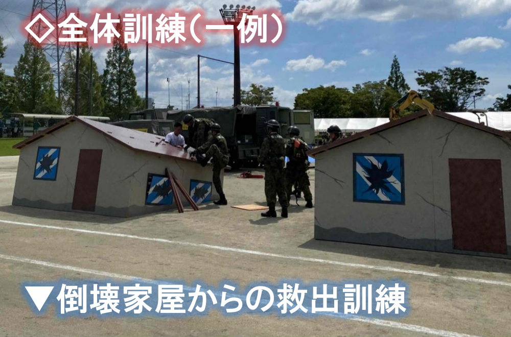
▼倒壊家屋からの救出訓練