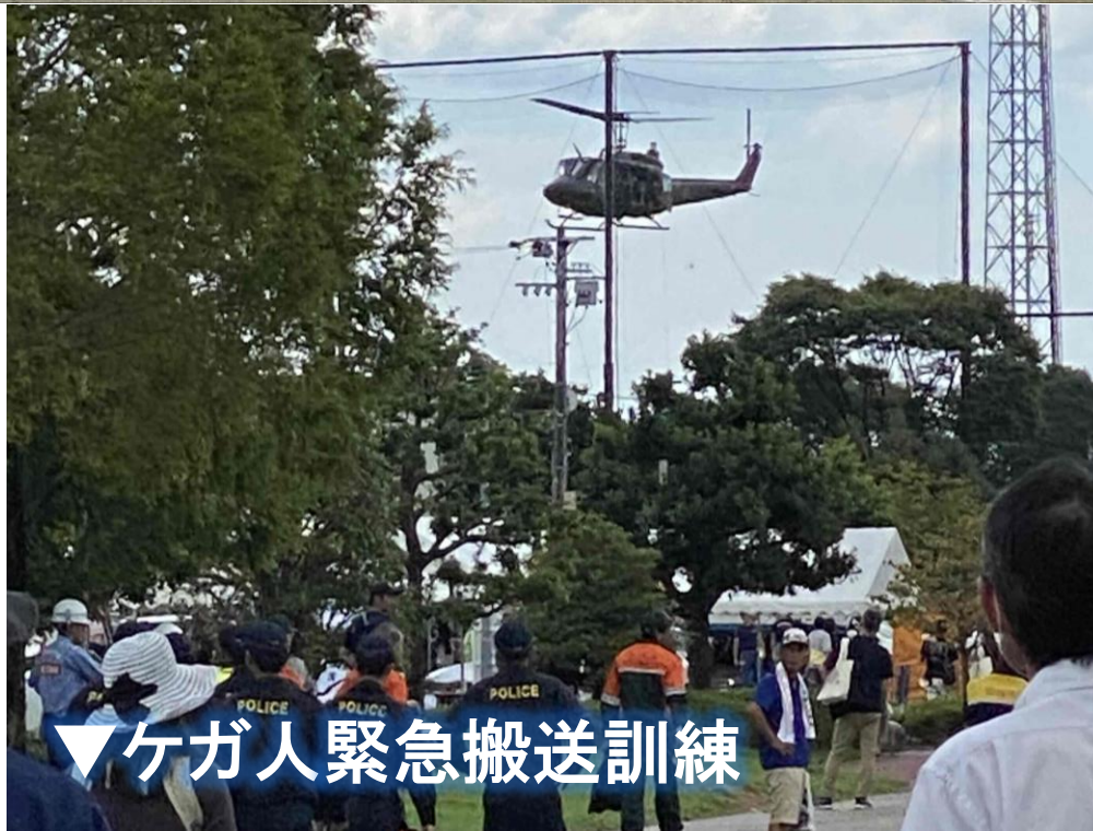
▼ケガ人緊急搬送訓練