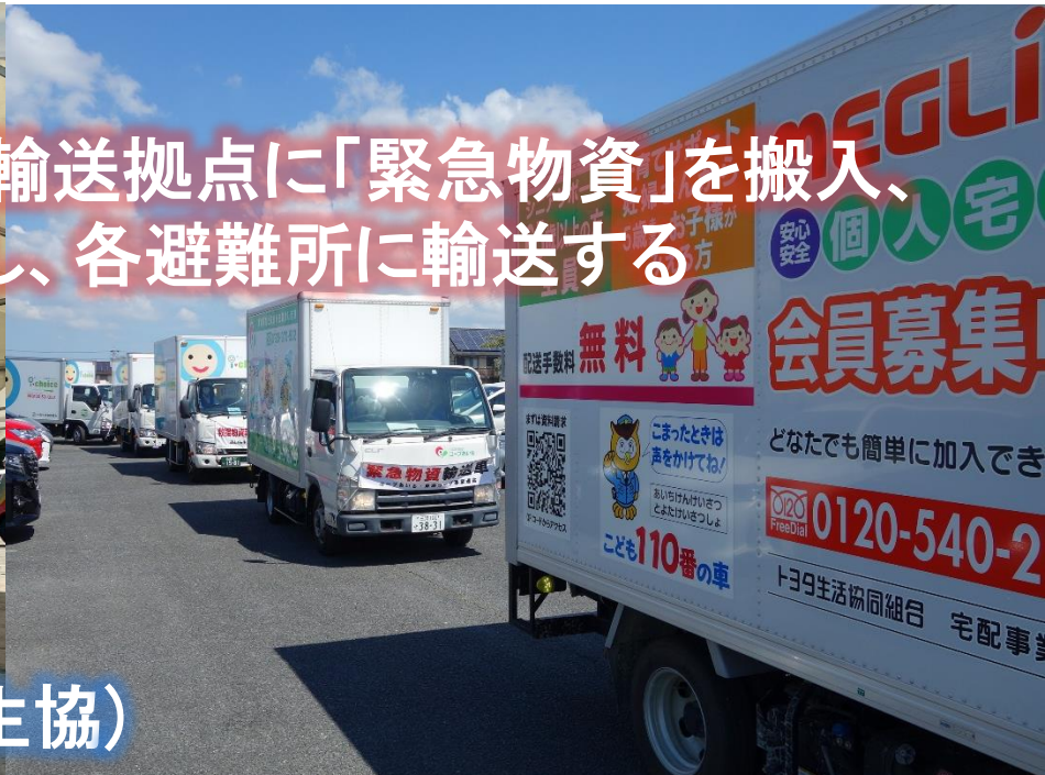
▼地域内輸送拠点に物資搬入(2生協)