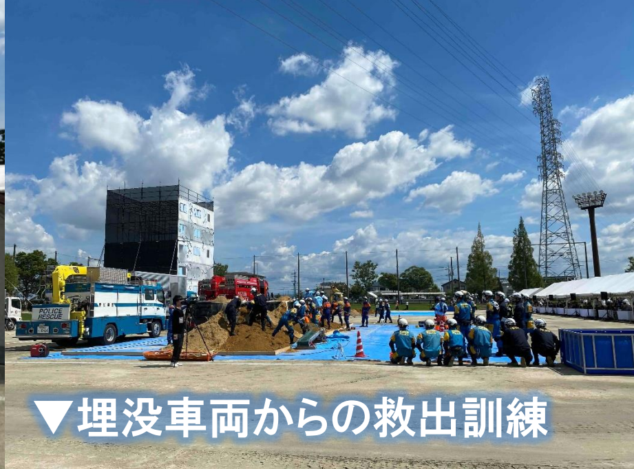
▼埋没車両からの救出訓練