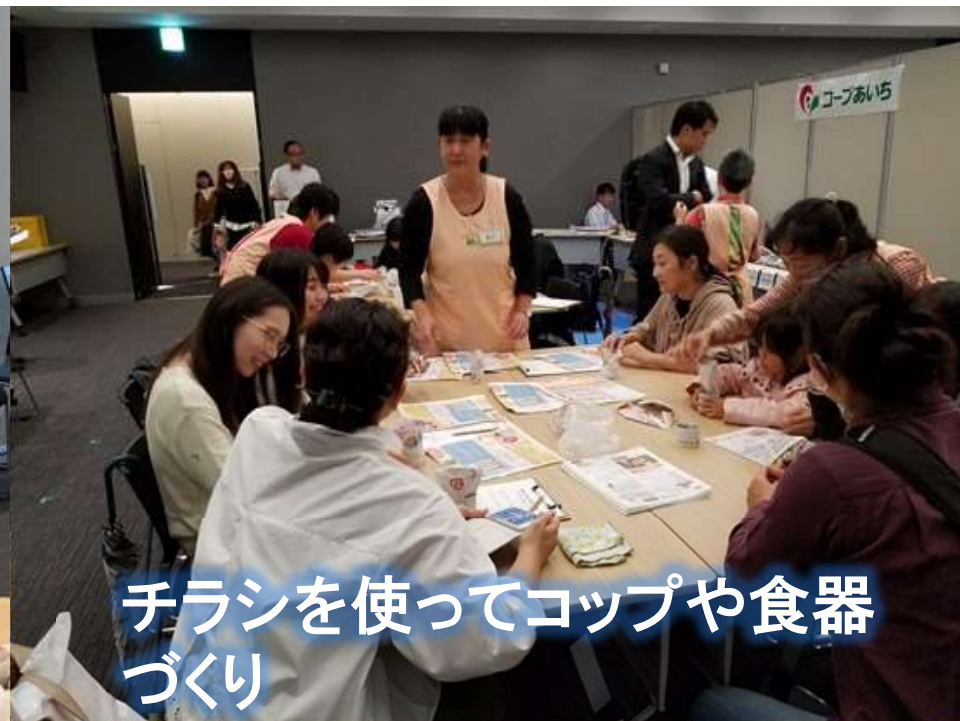
チラシを使ってコップや食器づくり